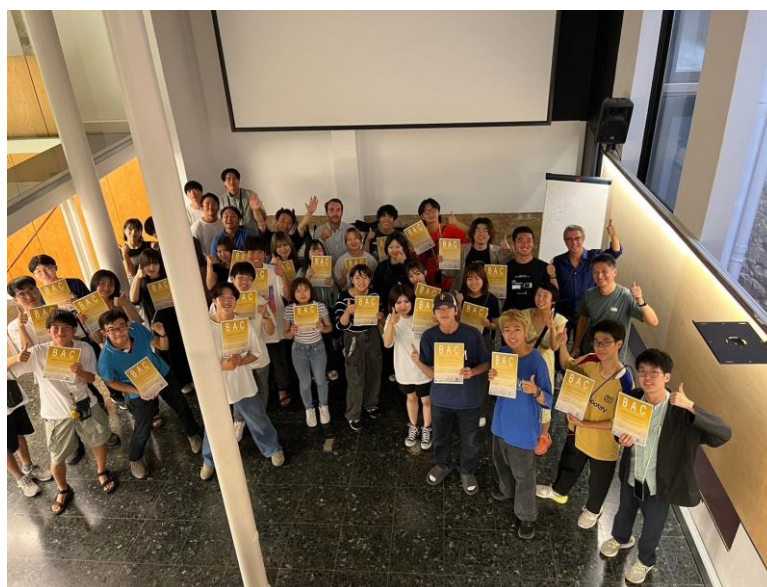
セレモニー集合写真

建築学部3コース合同による、学部2年生を対象とした海外建築研修をスペイン・バルセロナで開催し、プログラムには29名が参加した。バルセロナ・アーキテクチャー・センター(BAC)と共にプログラムを作成し、バルセロナ市内の建築見学会、グループによる自由建築見学、郊外建築ツアー、そして建築設計演習を実施した。設計演習では、バルセロナの海岸沿いを敷地として宿泊施設を3人もしくは4人のグループで行い、最終講評会では全員が英語でプレゼンテーションを行った。慣れない環境、知らない土地での課題は2年生にとっては難易度が高く思われたが、BAC教員の密度の高い指導、そして参加学生の高いモチベーションにより、全グループが素晴らしい作品を完成させ、目標を達成することができた。非常に濃密な2週間であり、参加学生にとっても刺激的なプログラムとなった。