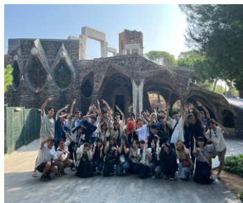
コロニアル・グエル見学会