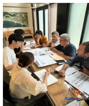
BAC教員によるエスキース