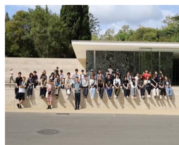
バルセロナパビリオン見学会