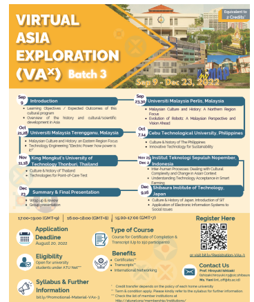
ATU-Netによるオンライン共同講義 〈Virtual Asia Exploration (Vax)〉

入学したすべての学生がオンラインで英語を学習できるアプリケーション「スーパー英語」を導入しており、正課科目とも連携している。課外講座としては「TOEIC対策講座」を用意し、学生の語学力向上に大きく貢献している。その他、英語での研究発表対策としての「プレゼン英語修得講座」や、会話能力を高める「毎日学べる英会話」など、学生のニーズに応じた幅広いメニューを用意している。