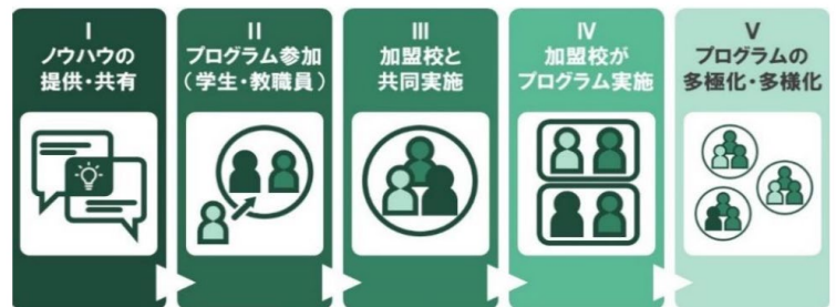
〈Conceptual Diagram of Global PBL Horizontal Expansion〉

In response to being selected for the “Japan Forum for Internationalization of Universities” in FY2021, we have been promoting horizontal expansion of Global PBL. We held a workshop to report on the implementation of global PBL and to share information on the design of PBL. In the future, SIT will create more interactive opportunities with the study group participants, aiming to multipolarize and diversify the program in the future.