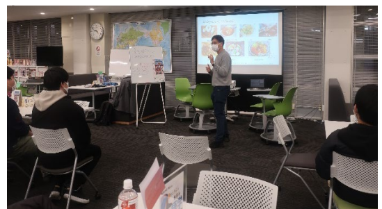
(Global Learning Commons)

Through these activities, Japanese students strengthen their interest in foreign countries, and international students also become attached to SIT.