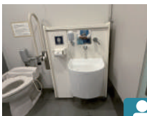
オストメイト対応