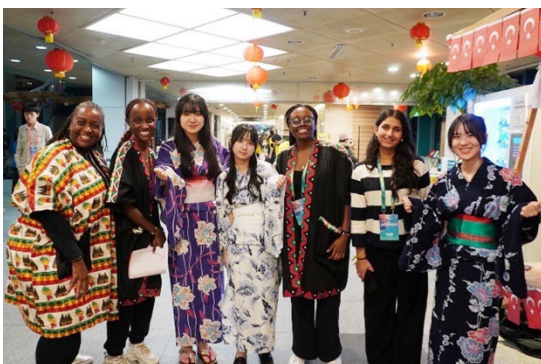
台湾国際科学フェアカルチャーナイトの様子