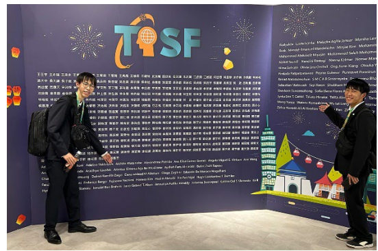
台湾国際科学フェアの様子 4