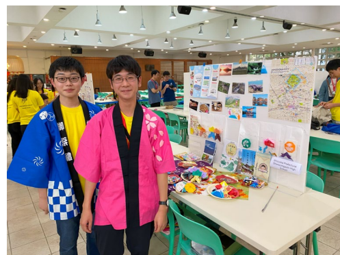
国際科学青少年フォーラム（シンガポール）の様子 3