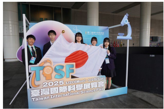
台湾国際科学フェアの様子 2