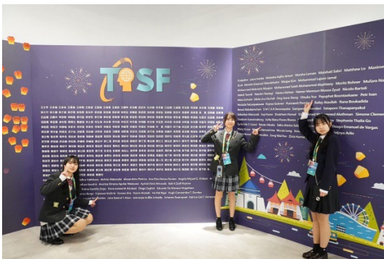
台湾国際科学フェアの様子 3