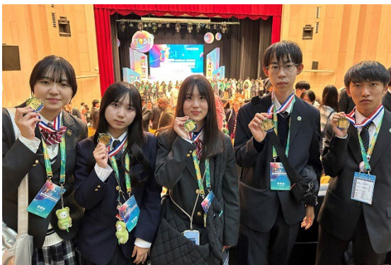
台湾国際科学フェアの様子 1