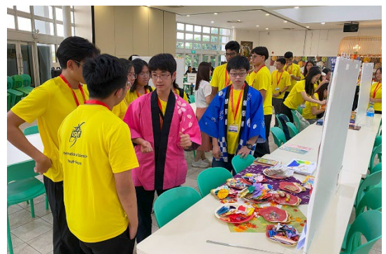
国際科学青少年フォーラム（シンガポール）の様子 1